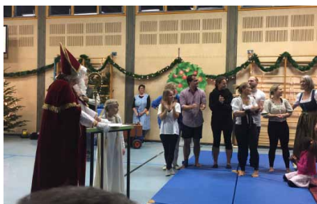
... und sein Besuch bei den Turnerkindern Aufräumarbeiten nach der Feier