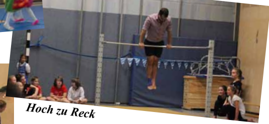
Hoch zu Reck