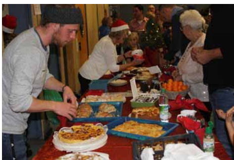
Kulinarisch verwöhnt mit Kuchen vom Buffet