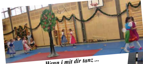
Wenn i mit dir tanz ...