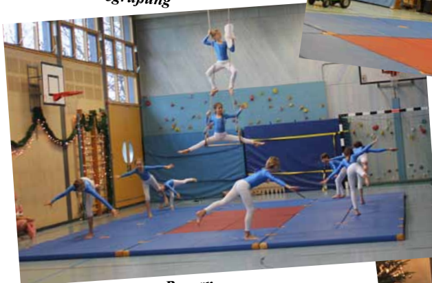
Himmel über Bayern