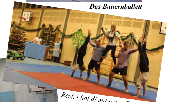
Resi, i hol di mit meim Traktor ab