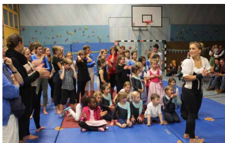
Vorfreude auf den Nikolaus ... Eröffnungsrede vom Vorstand