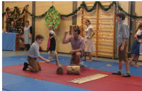
Holzhammerbaum im Takt